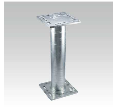
MPT 240x240+240x240, D114,3