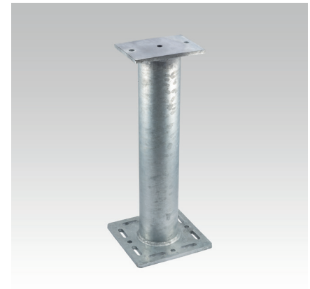
MPT 240x240+200x140, D114,3