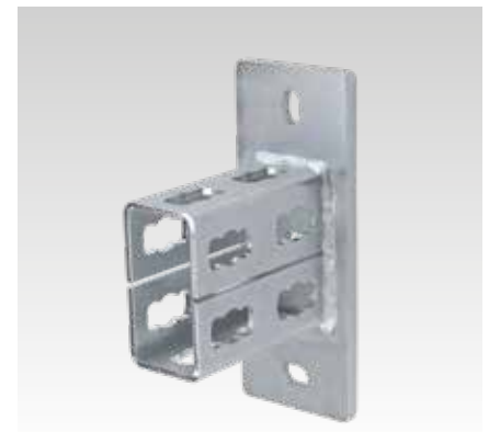
MPR-Sattelflansch Typ S+ für Profil 41/82 und 41/124