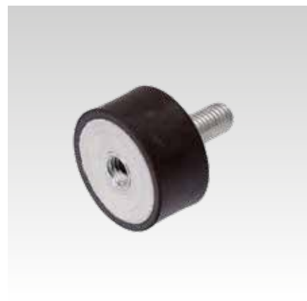
Schwingungsdämpfer mit Außen- und Innengewinde