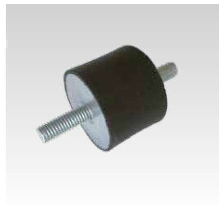
Schwingungsdämpfer mit beidseitigem Außengewinde