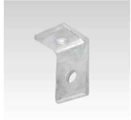
Größe 1, 2